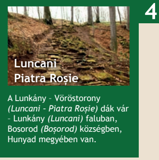
Luncani Piatra Roşie

A Lunkány - Vöröstorony ( Luncani - Piatra Roşie ) dák vár - Lunkány ( Luncani ) faluban, Bosorod ( Bosorod ) községben, Hunyad megyében van.