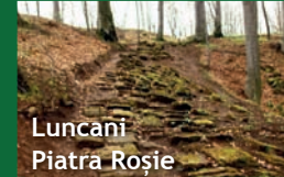
Luncani Piatra Roșie

Cetatea dacică de la Luncani - Piatra Roșie - localizată în sat Luncani, comuna Boșorod , județul Hunedoara.